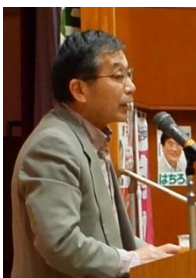
手稲区連合会表会長