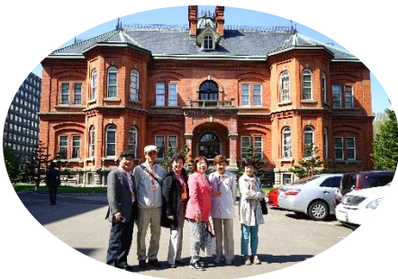
【道庁赤レンガ前で】